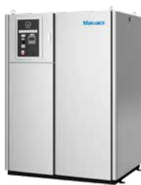
UP-300R ~ UP-600R 型