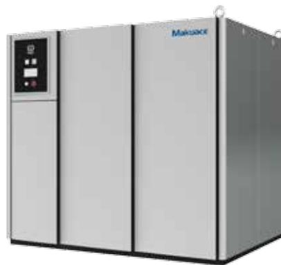
UP-1200R ~ UP-2400R 型