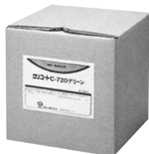
液体 20kg ダンボール箱入り